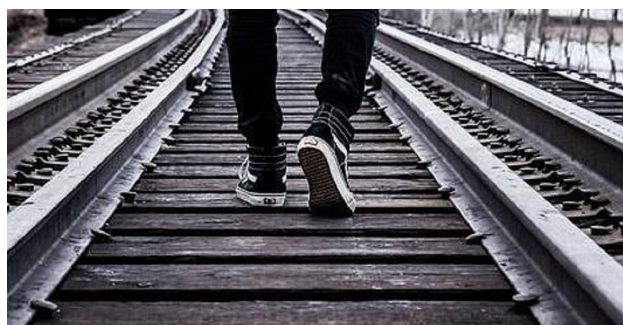
Camminando verso l'ignoto

E così con grande cautela, con rigide regole su distanziamento, igiene, entrate scaglionate, regolamenti di istituto e disciplinari studenti rivisti, previste sanzioni e ammonizioni per il contatto fisico, a settembre come di consueto, più manovrati da una politica nazionale che doveva farsi bella per scandire il rituale delle elezioni regionali siamo "ripartiti in sicurezza" tanto quanto si può viaggiare in sicurezza sulle strade statali per gli stessi motivi di incuria e risparmio.